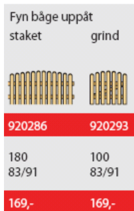
BILD 3: PRINCIPSKISS FÖR STORLEK OCH TYP AV GODKÄNT STAKET (ARTIKELNUMMER OCH PRISER FRÅN BAUHAUS 2008)

För avskiljare är det dessa tre som man får införskaffa: